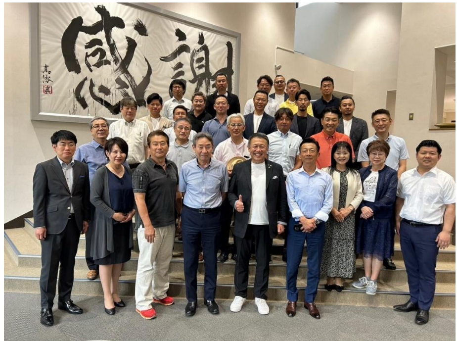
2024年7月理事研修会の記念写真