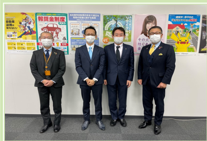
損保協会中部支部