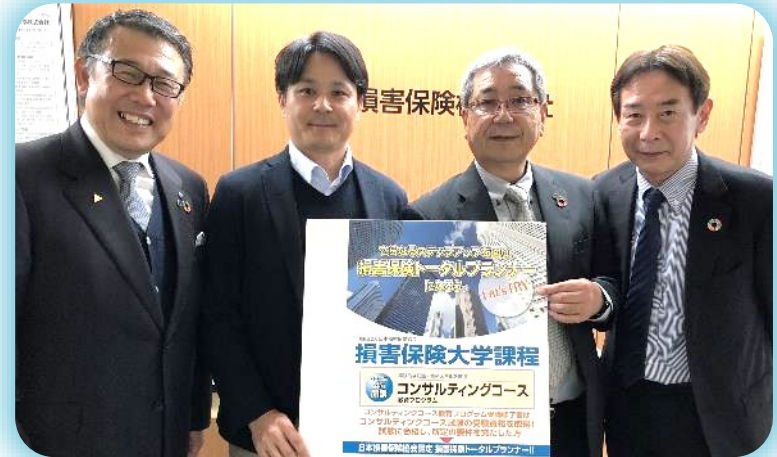
楽天火災海上保険 渋谷 営業2課長