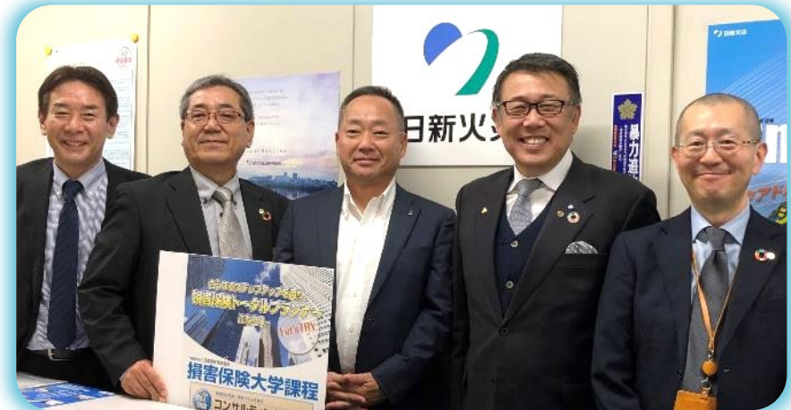
日新火災海上保険 大窟 東海第1事業部長