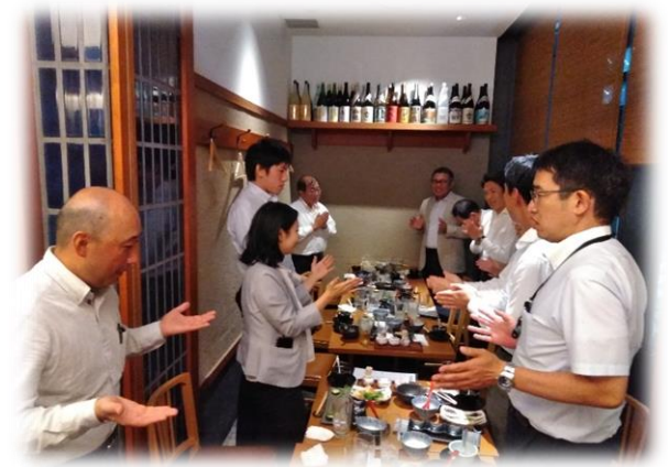
西支部会員さん・賛助会員さん みなさまご参加ありがとうございました。