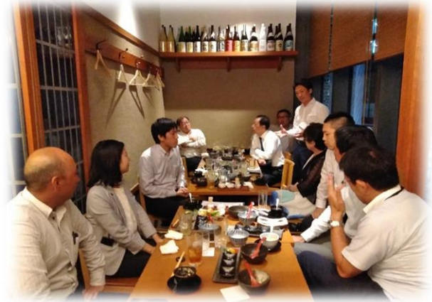
講習会終了後、納涼懇親会が開催されました。