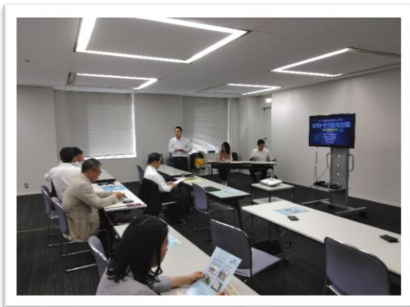
プロジェクター説明と動画視聴による防災講習でした。 今、この瞬間に起こるかもしれない、南海トラフ巨大地震