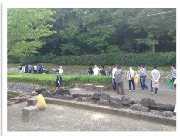
多くのご参加ありがとうございました。