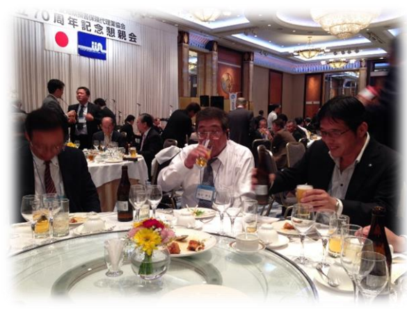
多くの会員さんが参加されました。