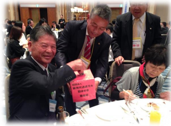
交通遺児のための募金活動！