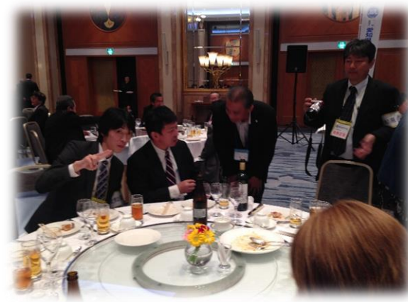
参加されたみなさまお疲れさまでした。